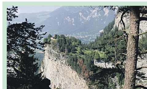
Hohen Rätien auf dem Felsisporn

Sommerlager 2022 – Beginn, Ferienheim Gufelstock GL Karin Wälli