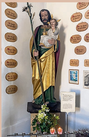
Josefstatue Pfarrkirche Unteriberg

Heiliger Josef, mein Freund, lehre mich im Alltag des Lebens dem Herrn zu begegnen!