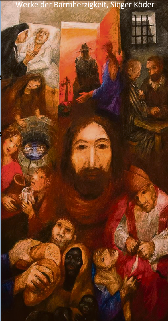
Werke der Barmherzigkeit, Sieger Köder