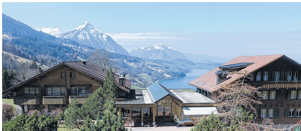
Begegnung mit Aussicht – die Meielisalp bei Leissigen.

Natürlich ging es um die Religion. Denn das ist auch das Zentrum der Konfirmation: Junge Menschen sagen «JA» zu ihrer eigenen Taufe und bekräftigen damit, dass der Glaube an Gott auch in Zukunft einen Platz in ihrem Leben hat. Aber wie sieht das aus, wenn man willkürlich Menschen auf der Strasse anspricht?