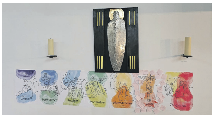
Text und Bild: Martin Buck SSR Berg

Am späteren Nachmittag des Karfreitags fand auch dieses Jahr wieder der Andere Kreuzweg statt. Mit einfachen Bildern, moderner Musik und eindrücklichen Worten wurde der Kreuzweg Jesu ins Heute geholt. Jung und Alt betrachteten gemeinsam die besinnlichen Impulse des unter dem Thema «beziehungsweise» stehenden Kreuzweges. Herzlichen Dank allen, die dabei waren und den eindrücklichen Anlass möglich gemacht haben.