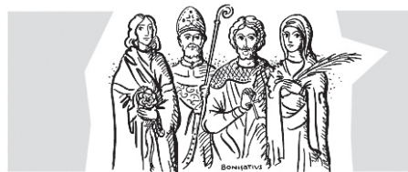
PAKRATIUS SERVATIUS BONIFATIUS SOPHIE M. H. OILBERT