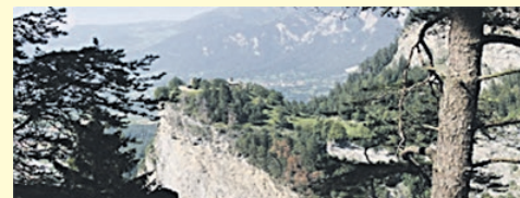
Hohen Rätien auf dem Felssporn.