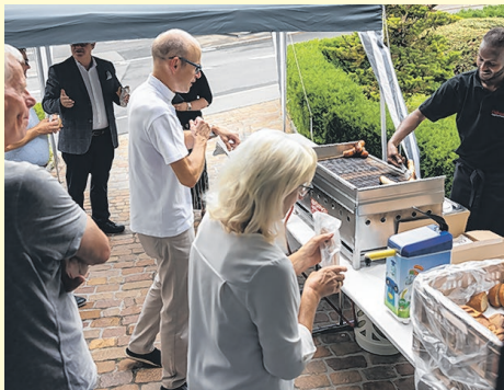
Bilder Joe Niederberger