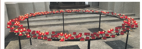
Bild St. Ursen Kathedrale, Solothurn

Nimm dir Zeit. Lass zu, dass du leer wirst am Ende. Fürchte nicht, du könntest die Werke nicht bringen, den Preis nicht bezahlen, wenn deine Spur sich zum Anfang wendet – das war's dann, verzweckt und begrenzt auf Lebenszeit. Fürchte dich nicht, nimm dir Zeit. Lass zu, dass du leer bist. Am Ende erwartet dich Fülle. Aus der Gemeindebibel