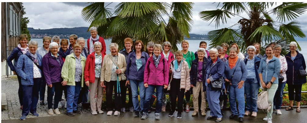
Die gut gelaunte Frauengemeinschaft auf der Insel Mainau.

Trotz miserablen Wetterprognosen füllte sich der Car bis fast auf den letzten Platz. Die Frauen der Frauengemeinschaft Schindellegi machten sich auf den Weg zur schönen Blumeninsel Mainau.