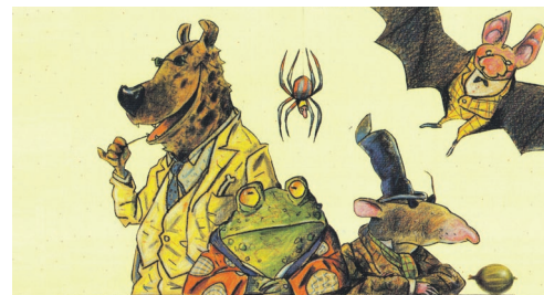
DIE FÜRCHTERLICHEN FÜNF

Ökumenisches Abendgebet Am Donnerstag, 21. Oktober , um 19:30 Uhr laden das ev.-ref. Pfarramt Höfe und die kath. Pfarrämter Pfäffikon und Freienbach zum ökumenischen Abendgebet in der Schlosskapelle ein. Der meditative Gottesdienst ist geprägt von Gesängen aus Taizé, die von einer Flötengruppe begleitet werden.