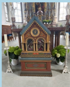
Reliquienschrein St. Theodor in Feusisberg