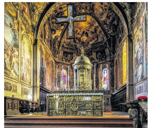
Dom von Monza