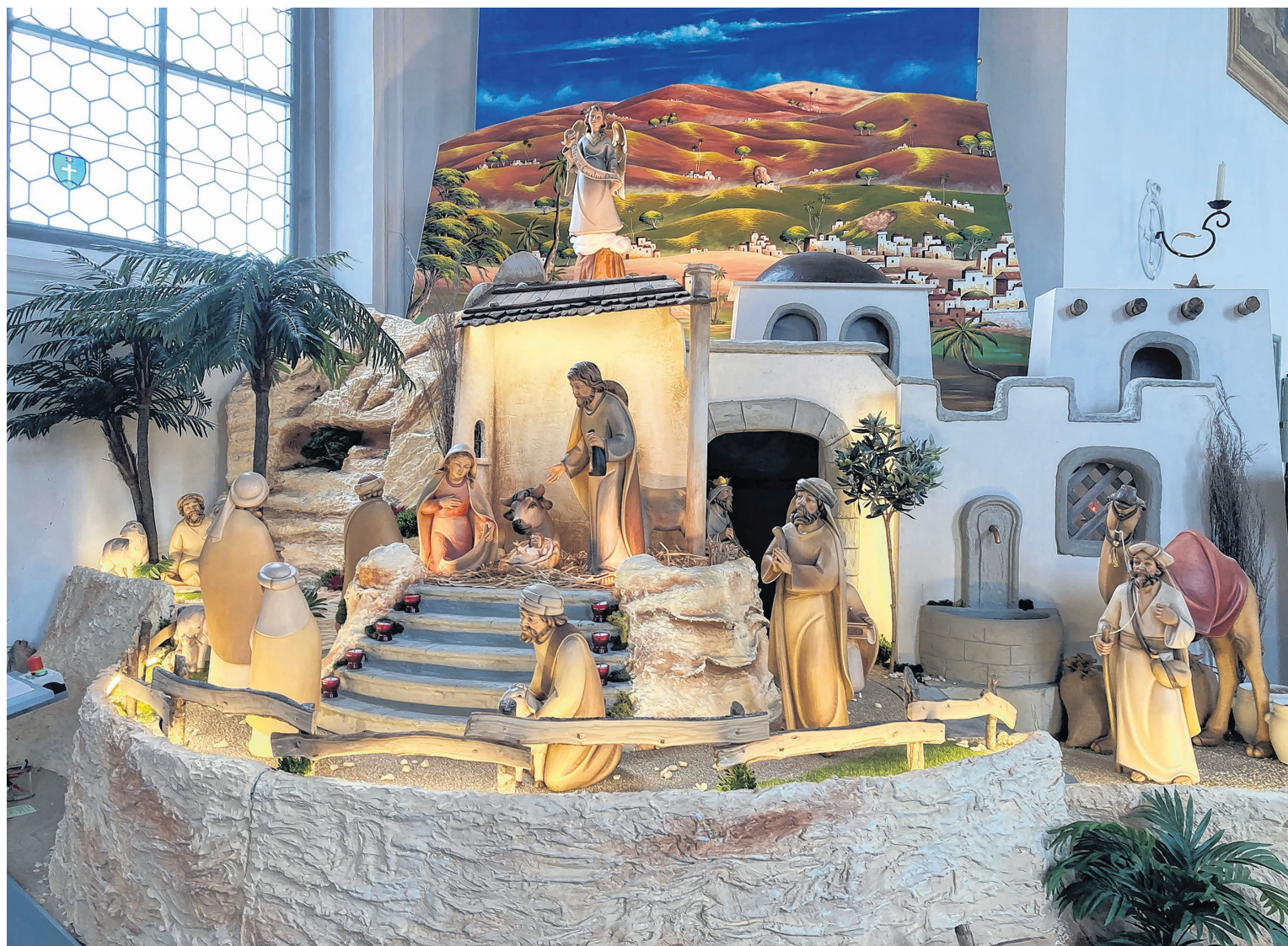
Krippe, Pfarrkirche Feusisberg