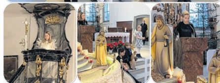
Bilder: stellvertretend für alle Mitwirkenden, Krippenspielgruppen vom Heiligabend.